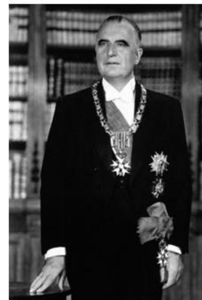
personnes travaillant dans l'agriculture.

On se trouve, a-t-il déclaré, en pleine discussion et on ne peut encore savoir si elles aboutiront maintenant ou au cours d'une autre réunion. Elles portent, on le sait, sur les directives incluses dans la résolution du conseil du 25 mars 1971 et notamment sur les mesures pour développer la production animale, la mise en place d'un fonds de modernisation, l'information socio-économique, la formation professionnelle des