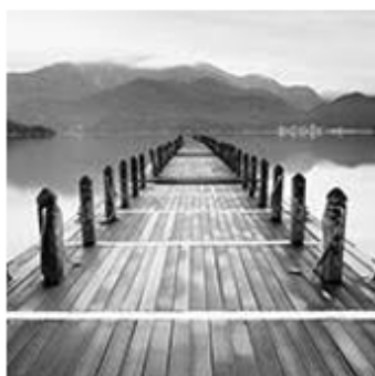
3- Pont de bois

Vivamus tempor blandit ante vitae gravida. Nam eu metus consequat, condimentum odio quis, finibus sapien. Curabitur vitae magna sed justo porttitor lacinia ut id turpis. Phasellus sollicitudin vel sem a dictum. Integer sagittis metus mauris, sit amet viverra dui efficitur sed. Pellentesque pulvinar elementum congue. Aenean placerat tortor tempus malesuada pulvinar. Nunc nec faucibus est. Fusce a mauris at tellus condimentum dapibus. Sed aliquam porttitor lorem vel feugiat. Duis pellentesque ullamcorper consectetur. Sed non quam quis augue laoreet accumsan et id massa. Proin vitae vestibulum orci. In et sagittis lacus. Maecenas et odio sed mauris congue efficitur.