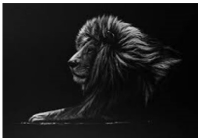
4- Lion noir & blanc

Vivamus tempor blandit ante vitae gravida. Nam eu metus consequat, condimentum odio quis, finibus sapien. Curabitur vitae magna sed justo porttitor lacinia ut id turpis. Phasellus sollicitudin vel sem a dictum. Integer sagittis metus mauris, sit amet viverra dui efficitur sed. Pellentesque pulvinar elementum congue. Aenean placerat tortor tempus malesuada pulvinar. Nunc nec faucibus est. Fusce a mauris at tellus condimentum dapibus. Sed aliquam porttitor lorem vel feugiat. Duis pellentesque ullamcorper consectetur. Sed non quam quis augue laoreet accumsan et id massa. Proin vitae vestibulum orci. In et sagittis lacus. Maecenas et odio sed mauris congue efficitur.